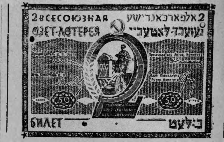
Общество землеустройства евреев трудящихся устраивает вторую Всесоюзную лотерею. На нашем снимке лотерейный билет

В связи с невыносимыми условиями жизни в Харбине, за последнее время усилилось бегство советских граждан из пределов Манчжурии.