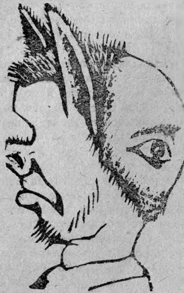
Не видит и не слышат

В лудильно-цинковальном цехе механического завода, цеховые организации и заведующий цехом, прислушиваются к голосу масс глазами, а на трудовую дисциплину смотрят ушами, в результате они не видят и не слышат.